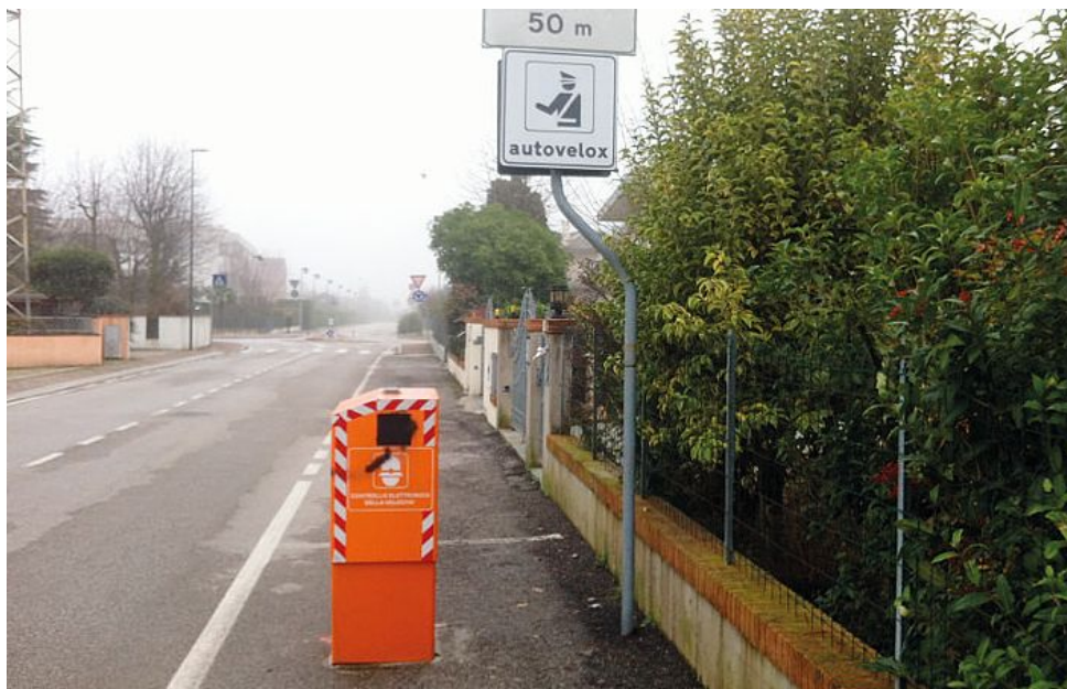
Una colonnina Velo Ok: a Tombolo ne saranno installate sei in altrettante strade entro questa settimana

Monitoraggio stradale: rilevate 6600 infrazioni al giorno Sei colonnine Velo Ok installate entro questa settimana